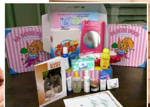
In de gewone roze doos zitten veel spulletjes met een grote ecologische voetafdruk.